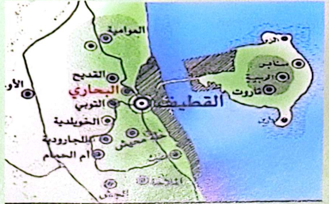
موقع البحاري عن محافظة القطيف