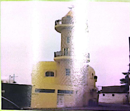
مسجد شيخ عزيز