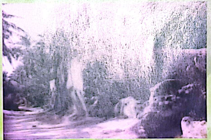
حمام أبو لوزة